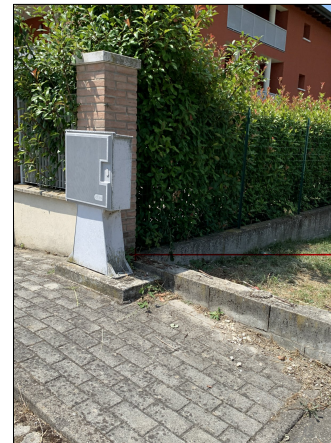
CAPOSALDO INDIVIDUATO SULLA MURA DI CONFINO IN ADERENZA AL PILASTRO DEL LOTTO LIMITROFO